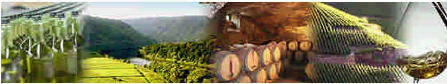
Wein mit Tradition und Leidenschaft Weinkellerei Peter Mertes KG Bernkastel-Kues